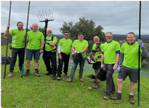
Equipo de 7 hombres de Irlanda del norte que vinieron una semana en Noviembre. ¡ Fue una nueva experiencia para ellos !

A diferencia del año pasado, esta última cosecha ha sido muy buena ¡ Hemos recogido 13.500 kg de aceitunas ! Damos gracias a Dios porque esto supone un aumento de ingresos para el Centro. Esta recolección no hubiera sido posible sin la valiosa ayuda de personas que vinieron a ayudar de forma individual o en grupo. ¡a todos muchas gracias por el esfuerzo y el apoyo moral que esto supone para nosotros !