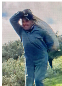
Miembros de la junta .....