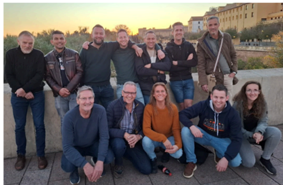
Dentro de este equipo de 12 holandeses algunos han venido cada año desde hace 20 años, otros vinieron por primera vez en Diciembre.