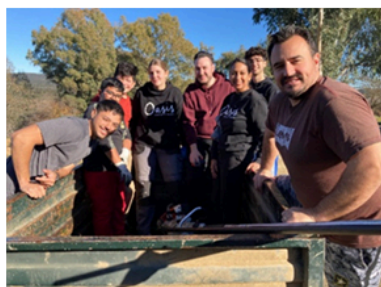
Jóvenes de una iglesia de Córdoba.....